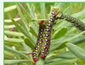
Lagarta da esfinge-da-eufórbia Spurge hawk-moth caterpillar Hyles euphorbiae Insecta / Lepidoptera / Sphingidae