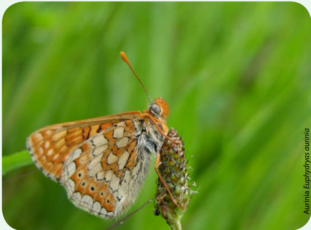
Aurinia Euphydryas aurinia